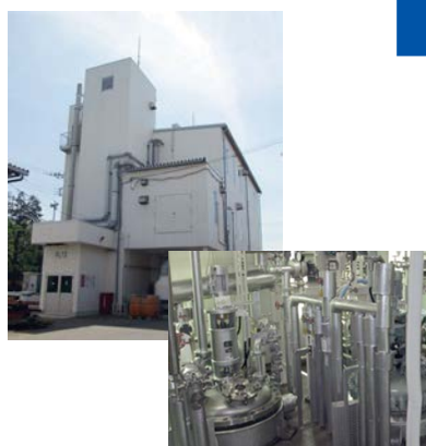
トロピカミド製造専用工場

1996年 トロピカミド製造専用工場完成 年間400~1000kgを製造 日欧米で30年以上の販売実績