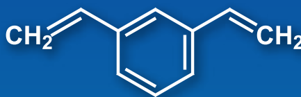
1,3-Divinylbenzene (stabilized with TBC)